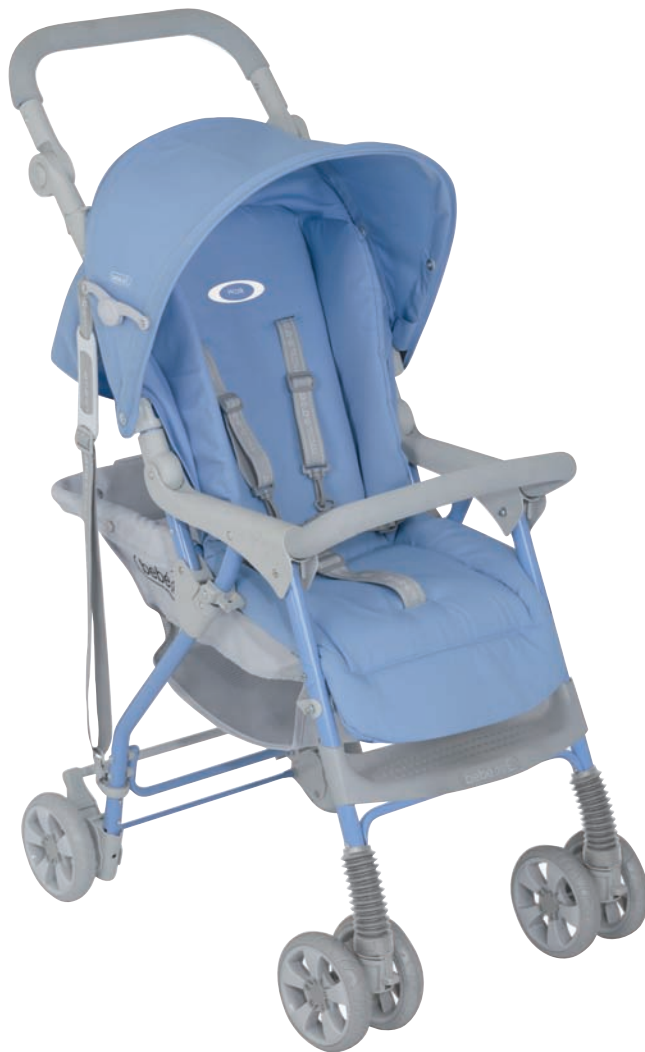
Silla Walk Cold Ref. 10606