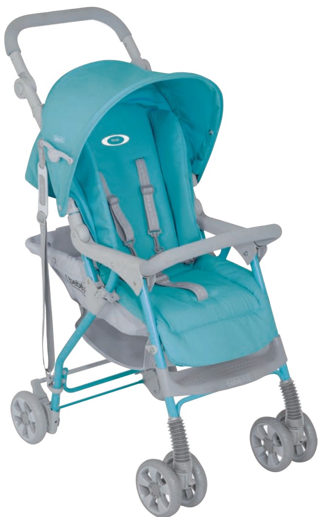
Silla Walk Turquoise Ref. 10609