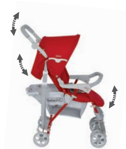
Manillar, reposapiés y respaldo regulables Adjustable handle, footrest and backrest