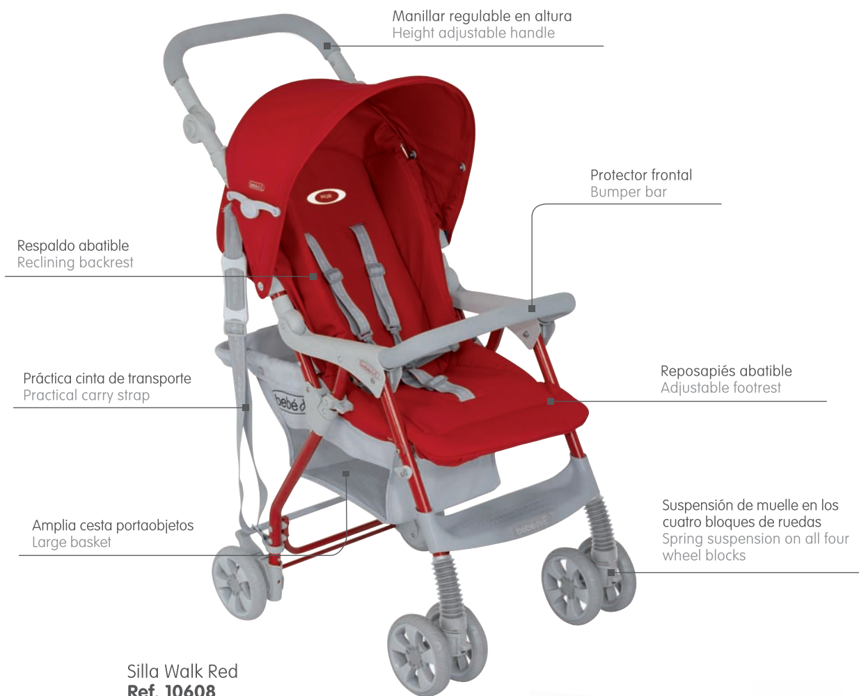
Silla Walk Red Ref. 10608